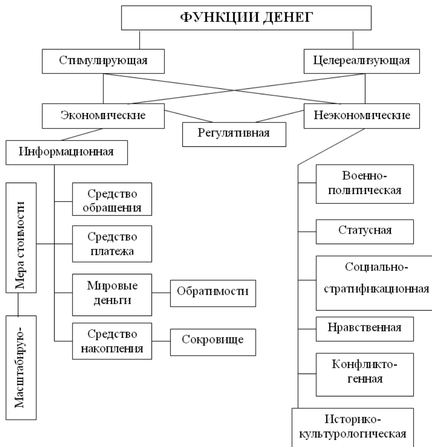
Рис. 3. Структурная схема функций денег.

что практически все без исключения современные деньги не имеют самостоятельной ценности (в отрыве от их номинального содержания), не мешает им выполнять многие другие функции. Более того, в современное время глобализации рынка если деньги будут иметь функцию сокровища, это даже затруднит выполнение некоторых других их функций. Например, рассмотрим такую функцию, как средство платежа. Если изготавливать деньги из драгоценных металлов, то для крупных сделок понадобятся многие тонны таких денег. Т.е. функцию сокровища можно в полной мере назвать устаревшей, не соответствующей